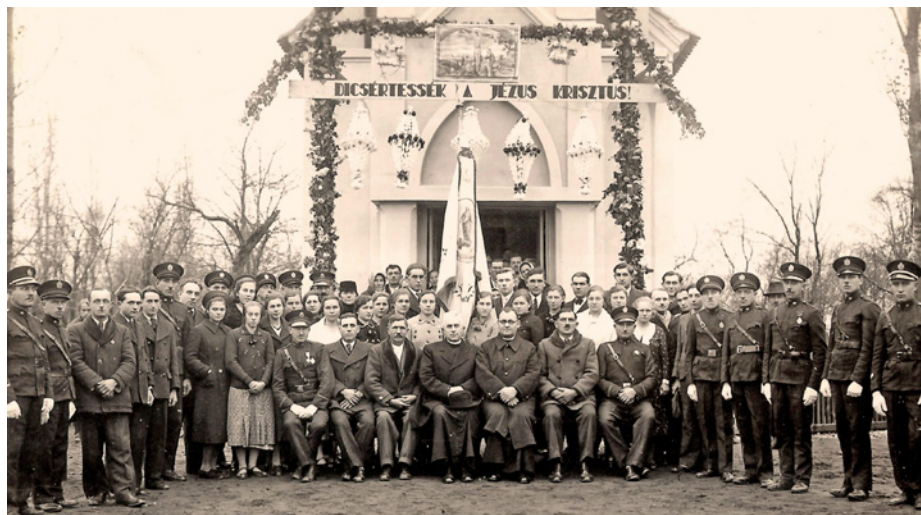
A kápolna felszentelése 1938-ban • Posvítitev kapelice leta 1938

A falu társadalmi élete igen sokszínű. A falusiak különböző egyesületekbe tömörülve alakítják a falu életét.