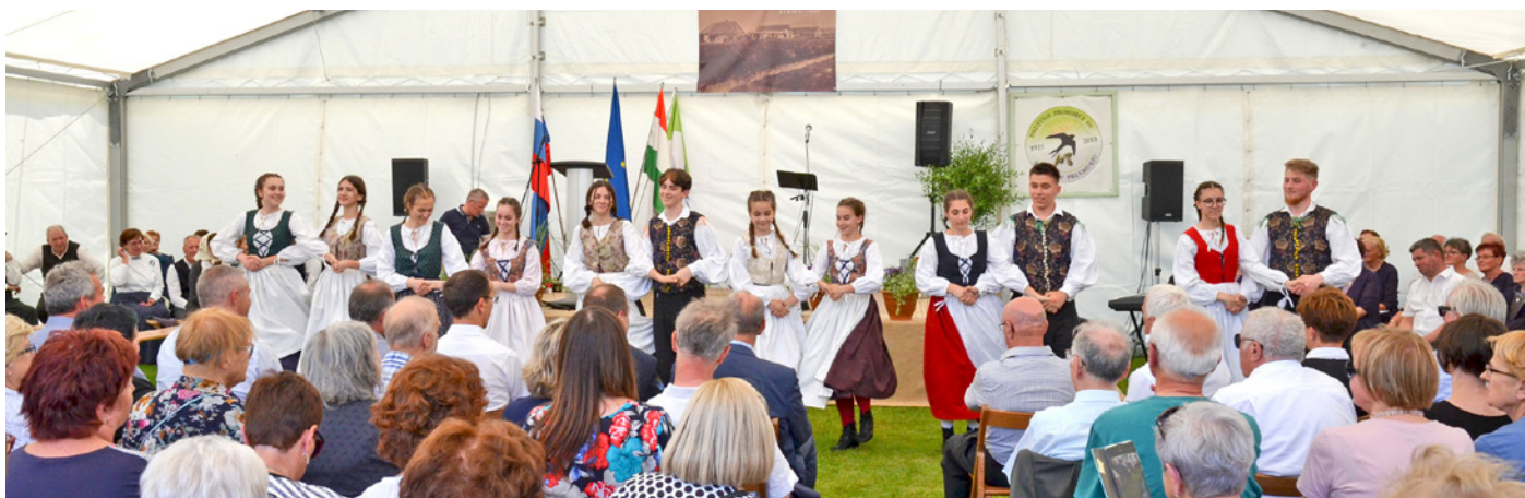
Folklorna skupina društva Slovencev Triglav iz Banjaluke • A Banja Luka-i Triglav Szlovén Egyesület néptáncosai

Potomci beguncev, ki so morali bežati od doma in so svoj novi dom našli na ravnini pod lendavskimi griči, imajo še po sto letih močan občutek pripadnosti skupnosti. Ne glede na vse se vztrajno medsebojno podpirajo, si pomagajo ter ohranjajo tradicijo svojih prednikov, a hkrati soustvarjajo zgodbo uspešne Lendave, zlasti večkrat nagrajeni podjetji Artex in Virs.