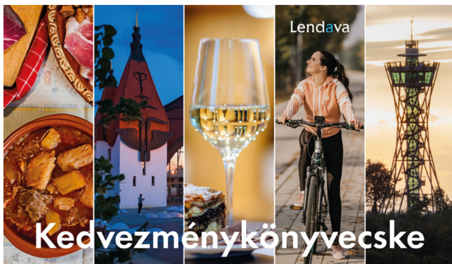
A kedvezménykönyvecske címlapja • Naslovnica knjžice ugodnosti

A füzet mostantól elérhetővé válik a Hotel Vinarium vendégei, valamint a többi turisztikai pont és promóciós esemény látogatói számára, és elsősorban azokat szólítja meg, akik a többnapos lendvai tartózkodást terveznek. A kedvezményfüzet szlovén és magyar nyelven jelent meg, elekt-