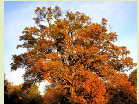
Tölgyfa a Zasuerdűben Hrast v gozdu Zasuerdű

1926 óta működik a völgyifalusi Önkéntes Tűzoltóegylet. Székhelyük a helyi faluotthon melletti tűzoltószertár.