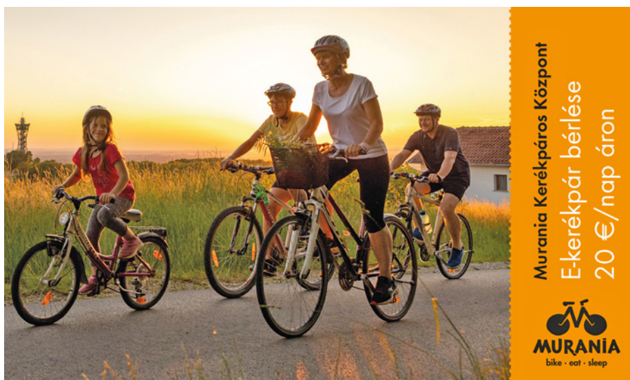
Az egyik kedvezmény a füzetben • Ena izmed ugodnosti v knjžici

A füzet a vendéglátók tavalyi promóciója és a gasztronómiai kalauz után egy újabb eszköz arra, hogy Lendva vonzóbb legyen, illetve az ide érkező turisták jobban eligazodjanak; a kedvezményfüzettel több okuk lesz ellátogatni a városközpontba és betérni a szolgáltatókhoz, aminek köszönhetően jelentősen több időt tudnak eltölteni úticéljukon.