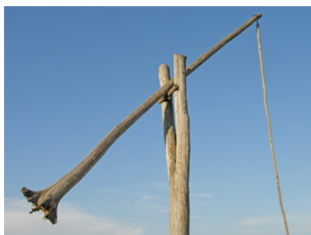
Az eredeti gémeskút • Izvirni vodnjak

A kulturális élet mindig is működött a faluban. Egyesületi minőségben 1980-tól működik a Petőfi Sándor ME, amelynek keretében a Népdkör, a Pünkösdi Rózsa Citerazenekar és a gyermekszekció gondoskodik a falu kulturális életéről.