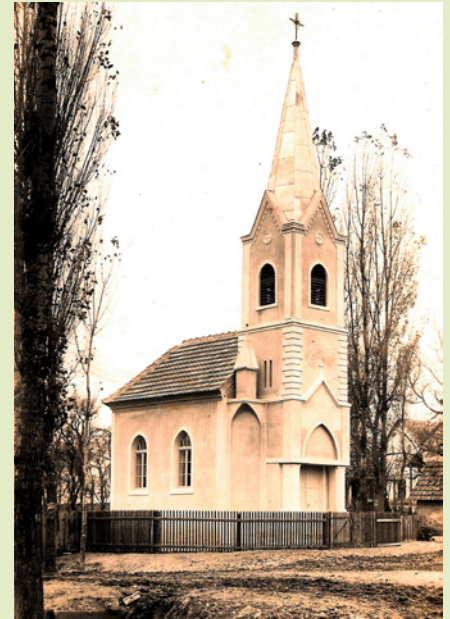
A völgyifalui kápolna 1938-ban Kapelica v Dolini leta 1938

A Zasuerdű már 15 éve ad otthont a Völgyifalunapnak. A gasztronómiai, hagyományőrző, kulturális, szórakoztató eseményen családok, barátok, ismerősök találkozhatnak, és minden korosztály talál magának elfoglaltságot, szórakozási lehetőséget.