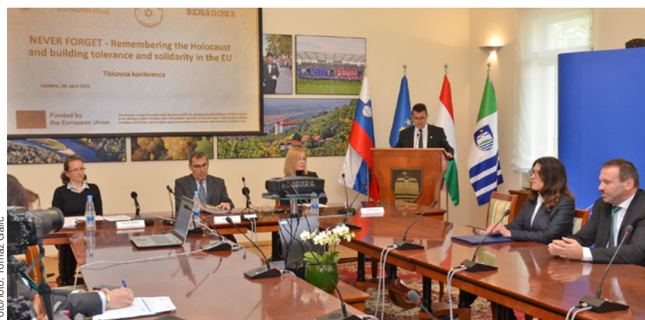
Predstavitve projekta Never Forget v mestni hiši. • A Never Forget projekt bemutatása a városházán.