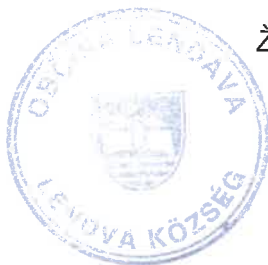
Janez MAGYAR Župan – Polgármester